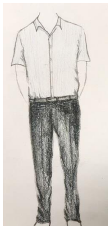
夏天校服 - 男生