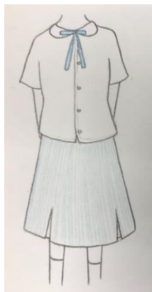
夏天校服 - 女生