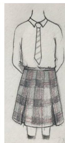
冬天校服 - 女生