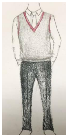
冬天校服 - 男生